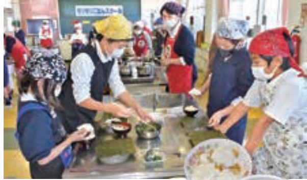
▲おにぎりを作る児童